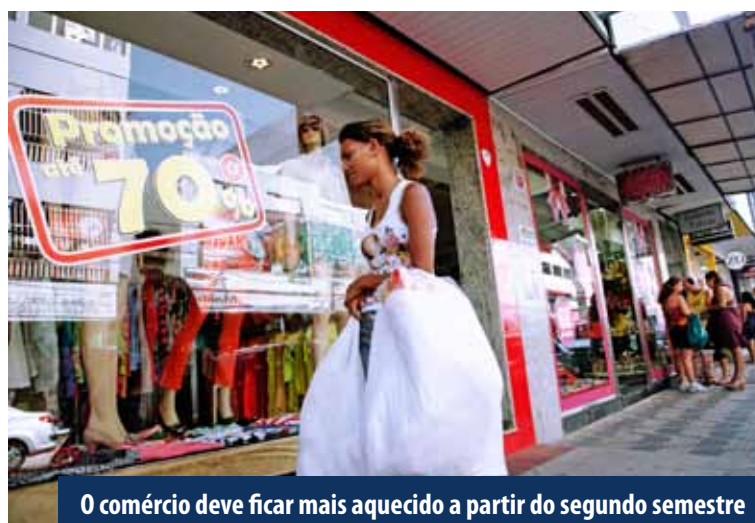
O comércio deve ficar mais aquecido a partir do segundo semestre