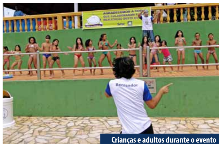
Crianças e adultos durante o evento

A ação foi resultado da colaboração de empresários parceiros, que viabilizaram o evento a partir de doações de alimentos e serviços de entretenimento, e