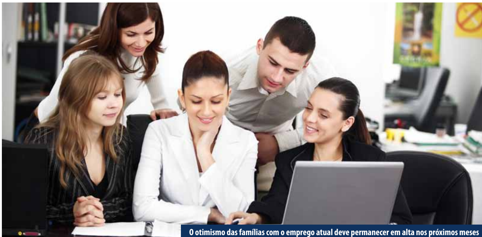
O otimismo das famílias com o emprego atual deve permanecer em alta nos próximos meses

A população está segura em relação ao emprego atual, mas deve manter o consumo moderado