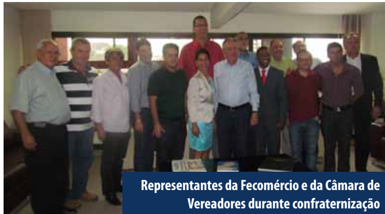
Representantes da Fecomércio e da Câmara de Vereadores durante confraternização