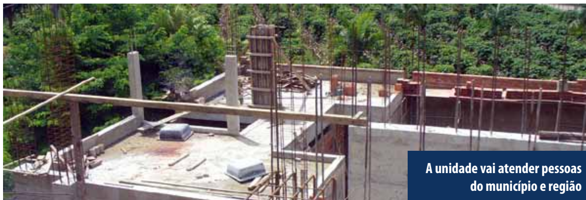
A unidade vai atender pessoas do município e região

Cursos como os de hotelaria a gastronomia devem ser oferecidos, devido à forte atuação do turismo na região