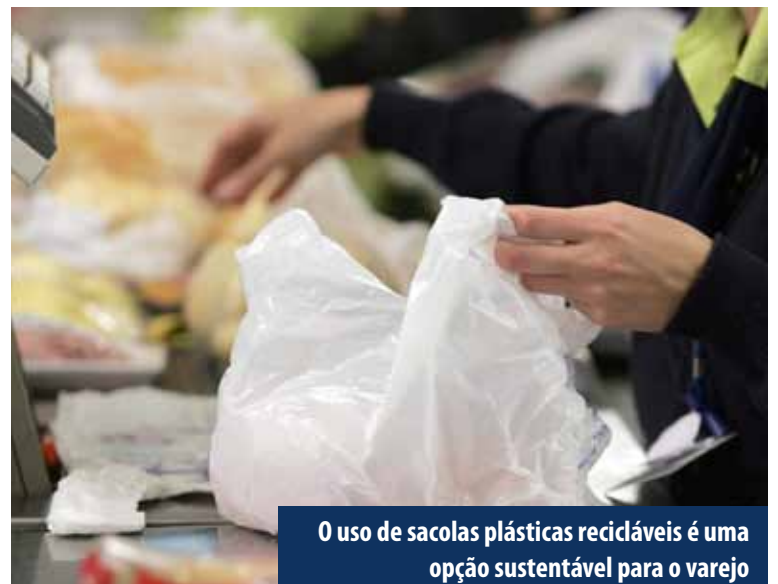
O uso de sacolas plásticas recicláveis é uma opção sustentável para o varejo

valorizar a imagem da marca frente a seus clientes, sendo um diferencial competitivo no mercado”, revela a analista.